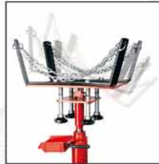
PF-1200A Plataforma ajustable con cadenas. Opcional.