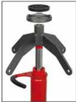
C-17 Platillo extra. Opcional.