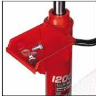
A-5187 El asa giratorio puede montar una caja portatornillos. Caja opcional.