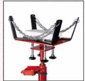
PF-1200A Bloque de espuma protectora. (A-5183). Opcional.