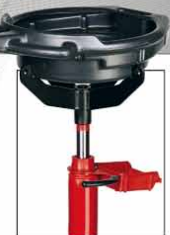
Soportes de nuevo diseño para alojar recogedores de aceite.