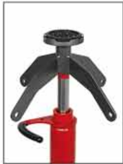
A-5181 Protección de goma. Opcional.